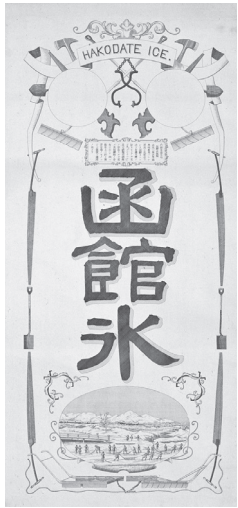
▲函館氷の広告

そのような五稜郭だが、数々の歴史的秘話や五稜郭を舞台とした逸話が伝えられている。私が7年前に入会したボランティアアガイドグループ「縁ジョイ倶楽部」では、観光パンフレットに載っていない逸話やこぼれ話を、五稜郭を訪れる皆様に紹介しながら楽しく公園を案内している。その逸話のひとつを紹介したい。