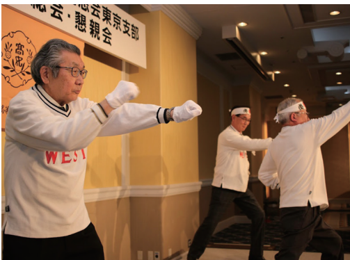
▲懇親会では、応援歌とパフォーマンスで会を盛り上げるのが恒例だった。

短大卒業後は大手建設会社に入社した。現場での仕事が多く、現場監督として仕事仲間とビールを飲みながら大いにコミュニケーションを取っていた。応援団長の気質が抜けず、職場のラグビー部の応援のため、退職後も各地の遠征に同行していた。こうした人柄がみんなに愛されて、同期会や同窓会への参加者も徐々に増えて、いつのまにか15、16名が固定している。同期会は毎年1、2回、函館や他都市からの参加者を交えた旅行会も行なっており、そんな時の彼は心から楽しんでいった。