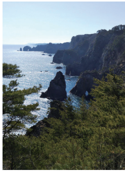
▲断崖が連なる海岸美を眺望できる北山崎展望台

帰りは北上。まず三陸のダイナミックな断崖が連なる海岸美を眺望できる北山崎展望台へ。海に降りることもできるので、階段が千段近くありそうで、途中の展望台でやめたものの500段近くもあって、もうへ口へ口でしたわ。