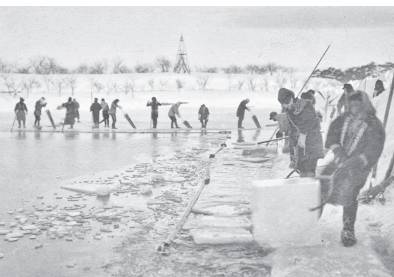
▲五稜郭伐氷図(函館市中央図書館蔵)