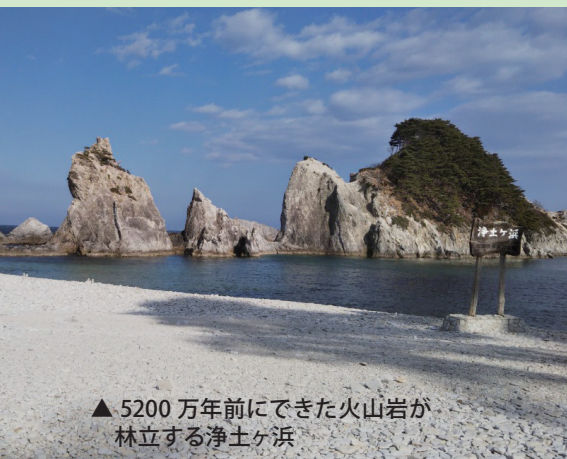
▲5200万年前にできた火山岩が林立する浄土ヶ浜