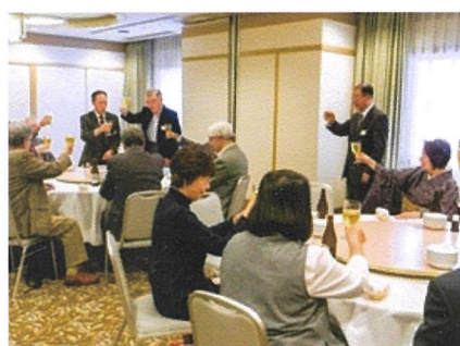
関西支部の総会は、京都、大阪、神戸の三都市を順番に開催。2019年11月、新大阪ワシントンプラザで。

なわれた関西つつじヶ丘同窓会に初めて参加し、大勢の先輩にお会いしてそれまで心のどこかにあった孤独感がこれだったのか、と不思議に安堵した覚えがあります。両親はずでに亡く、同郷の知人がいない孤独感がいつきに解消された思いでした。それから大阪、神戸、京都と場所を