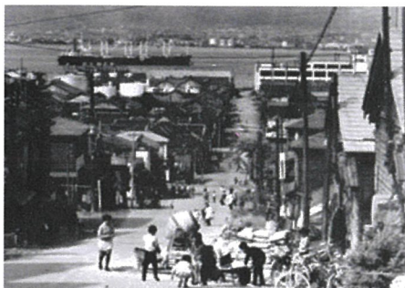
1965年代(昭和40年)の姿見坂 右建物は高松チキンの本社

業、今は廃業)。戦前は海軍の軍艦が入港すると、塩っぽい体を流そうと200名余りが一斉に訪れ、女風呂も男風呂として使用していたそう。さらに進むと大黒通りで、今は集合住宅が建てられているが、戦前は「大黒座」(演芸場)があり、いろいろないイベントが行なわれるワクワク・ドキドキ冒険心を煽る楽しい場所だった。