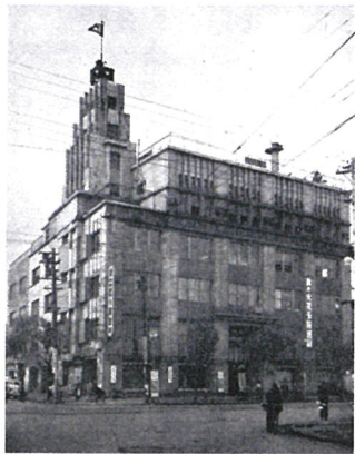
▲創業当時の棒二森屋。

棒二森屋百貨店(通称ボーニさん)は、「金森屋百貨店/文久3(1866)年創業」と「棒二萩野呉服店/明治15(1882)年創業」をルーツとして昭和11(1936)年の合併で開業。平成31(2019)年1月、82年の歴史に幕を下ろした。その跡地には、函館駅に向き合う旧アネックス館は24階建てシテイホテル(245室)に、市電通りに面する旧本館の北側には4階建て商業施設(1~2階は薬品・土産販売店、3~4階は公共施設)、南側には25階建てマンション(125戸)を建てる計画だという。ビルとしては函館市最高の高さ85mのランドマーク