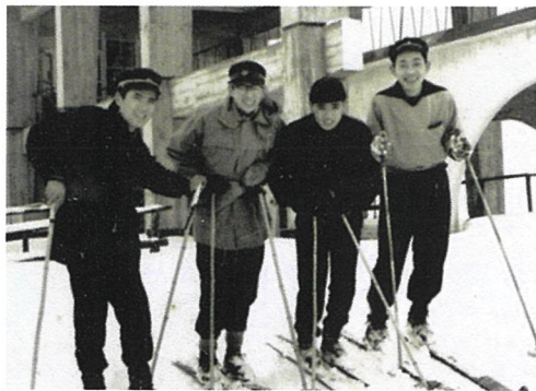
▲西高2年生の頃か？ 函館山山頂からのスキー滑走。学生帽をかぶっているのが懐かしい。昭和34年撮影

今、姿見坂の上に行き交う、バス運行を開始。昭和33年には函館観光事業会社が函館山ロープウェイを開業した。当時の料金は片道大人80円、子供50円でゴンドラ定員31人。搭乗時間は5分半だった。現在は5代目が運行し、定員125人、山麓駅から頂上展望台まで約3分。神戸摩耶山、長崎稲佐山と共に日本三大夜景と称される一大パノラマ。「壹百萬ドル」の夜景は、今も不変不動の存在感を發揮する。しかし、20年度の観光客数は前年度比42%減の310万2800人。市内宿泊外国人も激減(前年度は46万8869人)、世界的なコロナ禍によるインバウンド(訪日外国人)入国停止などの影響だ。毎年11月に開催される「市民感謝デー」のロープウェイ無料搭乗や頂上レストラン100円フード(カレールイス、焼きそば他)には長い行列ができるが、昨年は中止を余儀なくされた。コロナ時代でも往来自由を念じたい。