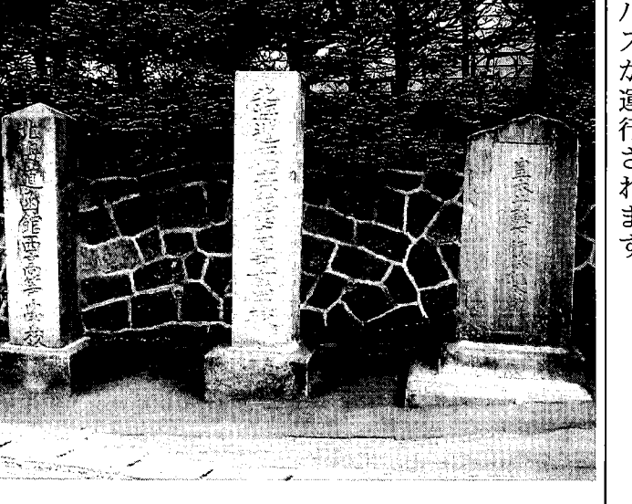
函館西高校碑・立高女校碑・大正天皇が皇太子殿下時代の行啓記念碑

多難な時代に母校を支えて下さいま した。諸先生を始め、先輩・後輩の皆 様の努力で今日に至っておりますこと を深く感謝申し上げます。 四年間通つた懐かしい校舎は、既にあ りませんが、目を閉じれば今でも昔の学 び舎が浮かび上がり、私の心の中には、 ついでに丘が美しく咲いております。 最後に、二十一世紀の函館西高等学校 の益々のご繁栄をお祈り申し上げます。