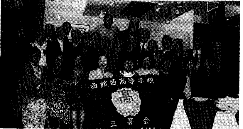
百周年記念行事参加感想文

皆様が、私共は西丘同窓会東京支部の幹事として、昨秋に創立百周年記念行事を行いました。