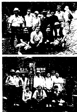
写真上：秋川渓谷ツアー 下：尾瀬ヶ原ツアー

年金受給年齢に達し、銀座がんこ中心の飲み会から郊外散策などの活動に中身が変って来ました。十九年度の主な行事を紹介いたします。