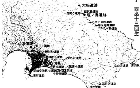
函館市の主な先史時代の遺跡分布

この遺跡群から二千七百年に国宝に指定された「中空土偶」や世界最古の漆製品など、貴重な遺物が数多く出土しており、「内浦湾沿岸の縄文遺跡群」として、北海道遺産に認定されています。